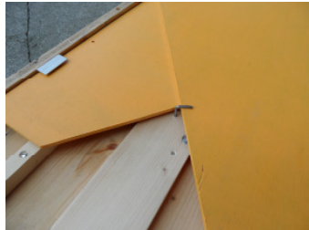
Seitenschutz auf Rückseite anbringen