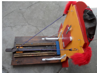
Gummiseile unten und oben einspannen