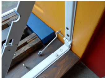
Stützen hochklappen und einhängen