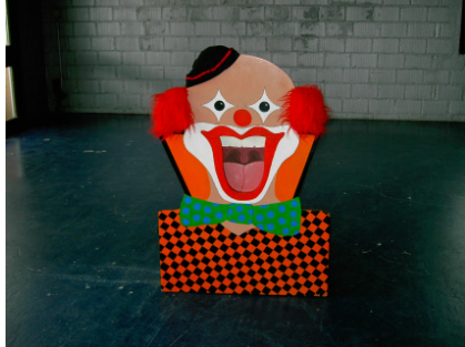
Mohrenkopfschleuder inkl. Bälle