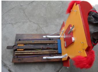
Seile wieder demontieren